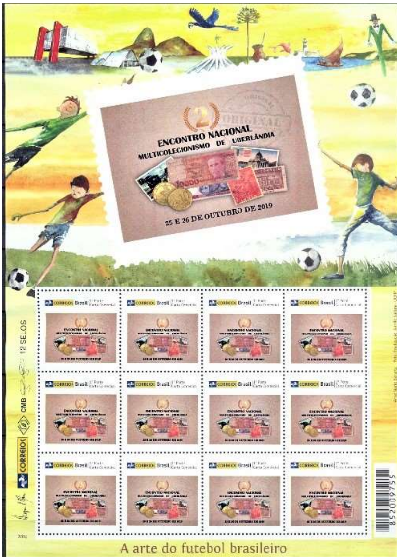
A arte do futebol brasileiro